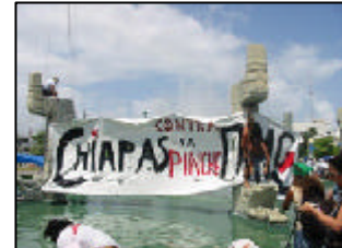
Marcha de organizaciones sociales en el pueblo de Cancún.