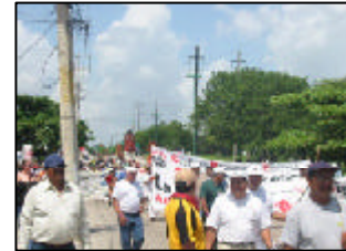
Marcha de organizaciones sociales en el pueblo de Cancún.